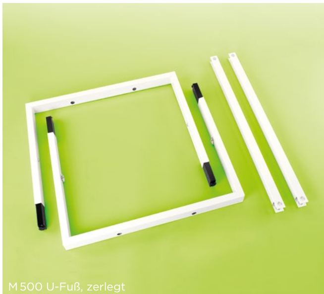
M500 U-Fuß, zerlegt

M500 besteht durch eine sehr geringe Anzahl an Bauteilen, die mit geringem Aufwand montiert werden können. Das bedeutet Zeitersparnis bei einer optimierten Logistik – ohne Einschränkungen in puncto Stabilität.