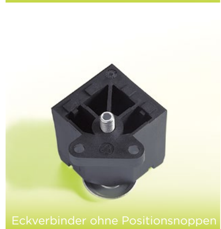
Eckverbinder ohne Positionsnoppen

Es stehen eine Reihe unterschiedlicher Stellteller zur Verfügung: Entsprechend dem Bodenbelag und der Möglichkeit einer Höherverstellung direkt an den Stelltellern variieren die Versionen. Dabei können die Teller drehbar oder fest fixiert sein.