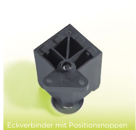
Eckverbinder mit Positionsnoppen