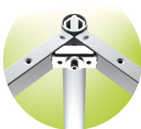
Reihe M 700 R