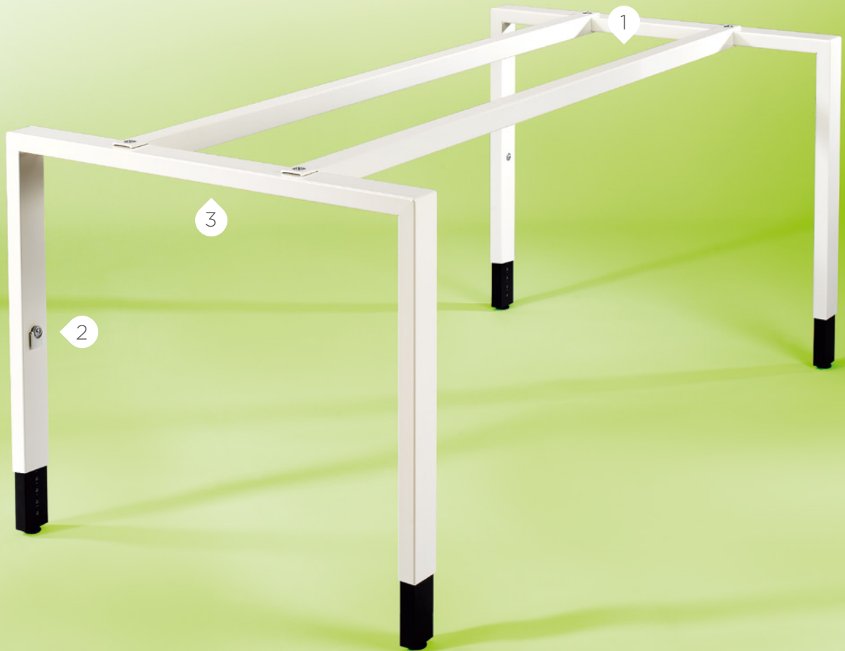
M 500 U-Fuß

Das Tischsystem 500 von Merkt kann als Einzeltisch eingesetzt werden, aber auch als hochkomplexes Arbeitsplatzsystem, das allen Anforderungen an heutige und zukünftige Arbeitsumgebungen gerecht wird.